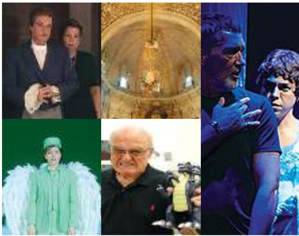
'Kraus, el último romántico', 'La festa (La fiesta)' VOSE, 'Gypsy en el Soho. El Sueño de Antonio Banderas', 'Alexina B. Vides en composició (Alexina B. Vidas en composición)' VOSE y 'Luis Gordillo. Manual de instrucciones'