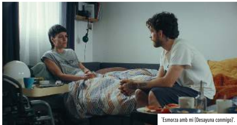
'Esmorza amb mi (Desayuna conmigo)'.

con problemas económicos, sufre un accidente y se reencontra con Salva, quien pretende dejar el pasado atrás y busca redención. Él desea un nuevo comienzo con Carlota, que está lidiando con su pasado y con su obsesión por