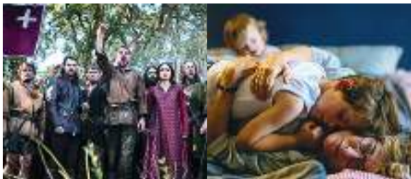
'Guillermo Tell (William Tell)' y 'L'attachement (Los lazos que nos unen)'.