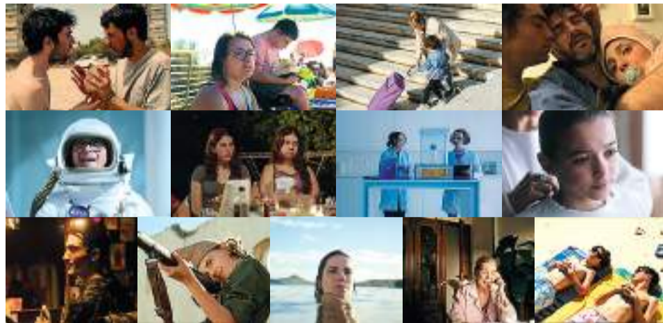
DE IZQUIERDA A DERECHA. PROGRAMA 3: 'Còlera (Còlera)' VOSE, 'De sucre (De azúcar)' VOSE, 'El norte', 'Instinto paternal', 'Marciano García', 'Nens (Niños)' VOSE y 'Planetagatik (Por el planeta)' VOSE. PROGRAMA 4: 'Abril', 'Kokuhaku' VOSE, 'La idea de una isla', 'Lo que no se ve', 'Maruja' y 'Pipiolos'.

La sala 2 de Alcazabilla exhibirá a las 16.15 horas los siete títulos seleccionados en el programa 3. Luis Arrojo nos traerá 'Marciano García', cuyo protagonista, un hombre con síndrome de Down, encuentra en su fantasía por convertirse en astronauta la excusa perfecta para no afrontar la muerte de su abuelo. José