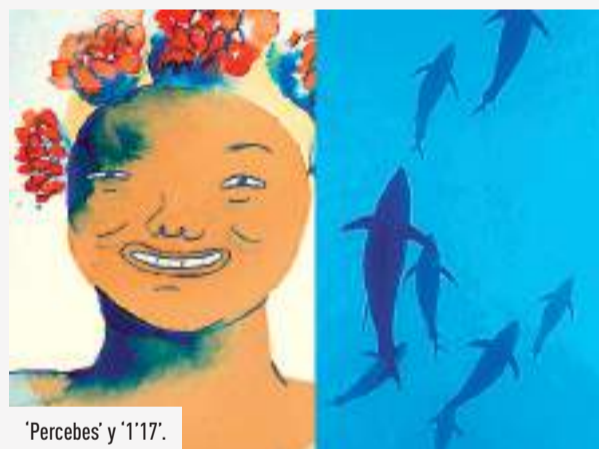
'Percebes' y '1'17'.

La sesión se completará con 'Percebes', un cortometraje de animación portugués realizado por Alexandra Ramires y Laura Gonçalves. Ambas cineastas nos llevan hasta el Algarve para seguir el ciclo completo en la vida del percebe, desde su formación hasta el plato del