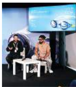
Impromptu AI presentation. J. Domínguez

This discipline was the focus of the talk "Artificial Intelligence in the creative industries" with representatives from Google Spain; Banijay; Atresmedia and content creator Brais Moure, in which they dis-