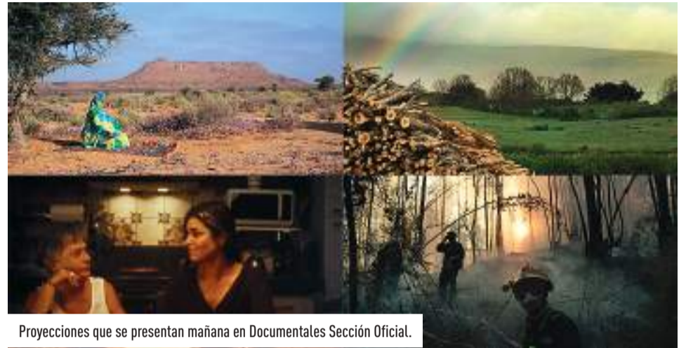
Proyecciones que se presentan mañana en Documentales Sección Oficial.

La coproducción hispano-argentina 'Suerte de Pinos' completa la programación de este primer pase