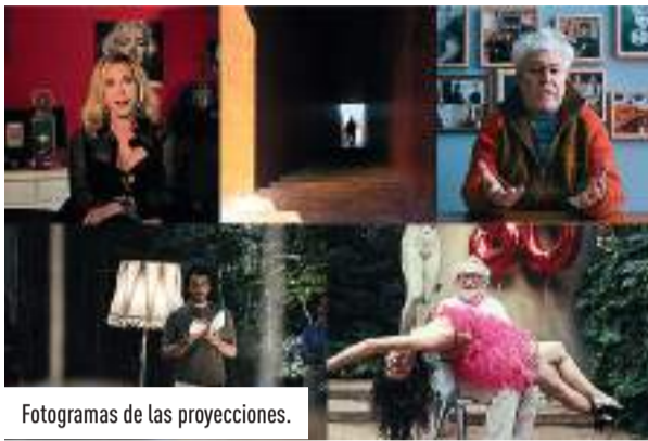
Fotogramas de las proyecciones.