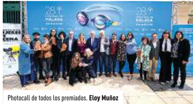
Photocall de todos los premiados.