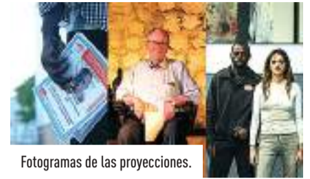
Fotogramas de las proyecciones.