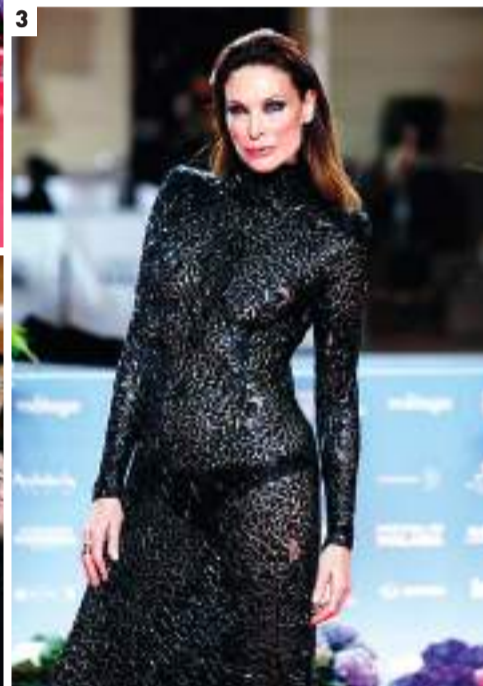
1. El humorista Javier Coronas participa en la película 'Pequeños calvarios', de Javier Polo. 2. Foto del equipo artístico del largometraje 'El hombre normal', de Miguel Ángel Almanza. 3. La actriz y modelo Cristina Piaget. 4. El actor malagueño Salva Reina. 5. Arturo Valls se hace un selfie con el público asistente a la alfombra roja. 6. Dani Fernández, entre Alberto Ortega y Charlie Arnaiz, los directores del documental sobre el cantante. 7. La actriz Yelidá Díaz. 8. Miguel Ángel Silvestre.