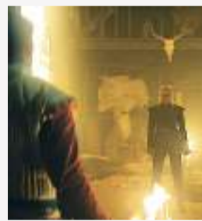
'Estocolmo, 1520. El rey tirano'

vengarse de los hombres que asesinaron brutalmente a su familia. Ambas historias confluyen en el corazón de Estocolmo, donde las hermanas se ven arrastradas a una despiadada lucha política entre Suecia y Dinamarca, que culminará en el conocido 'Baño de Sangre de Estocolmo'.