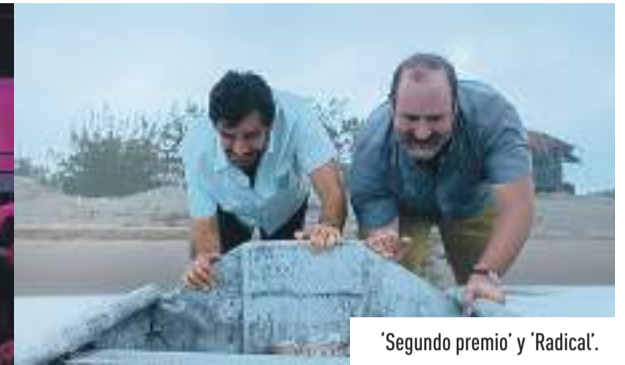
'Segundo premio' y 'Radical'.