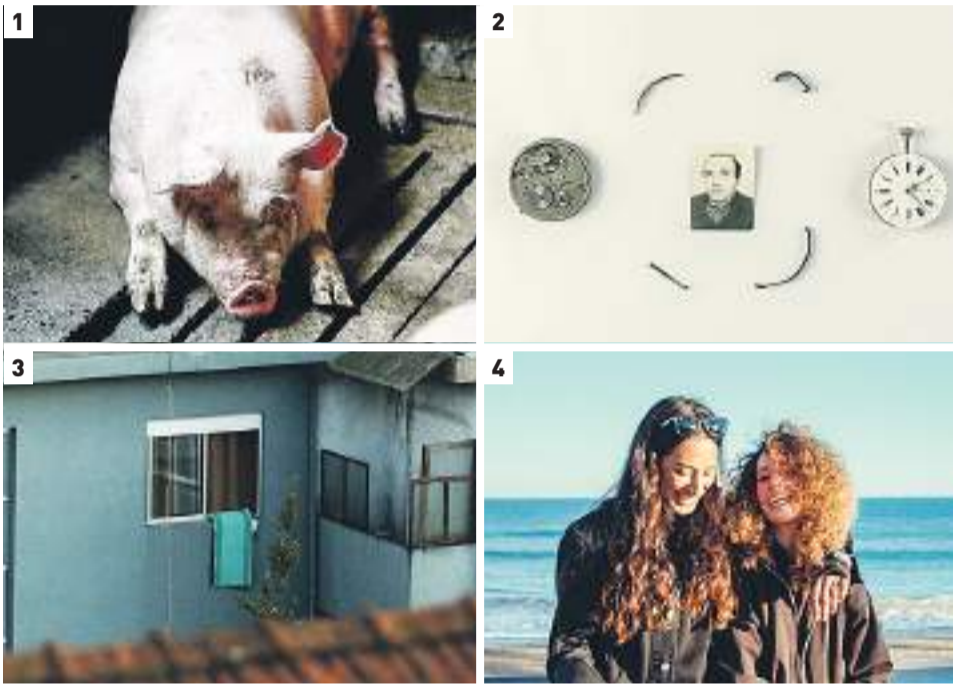
1. 'Petges a l'herba' (VOSE). 2. 'El retrato de mi padre'. 3. '2ª Pessoa' (VOSE). 4. 'Alteritats (Otrredades)' (VOSE).