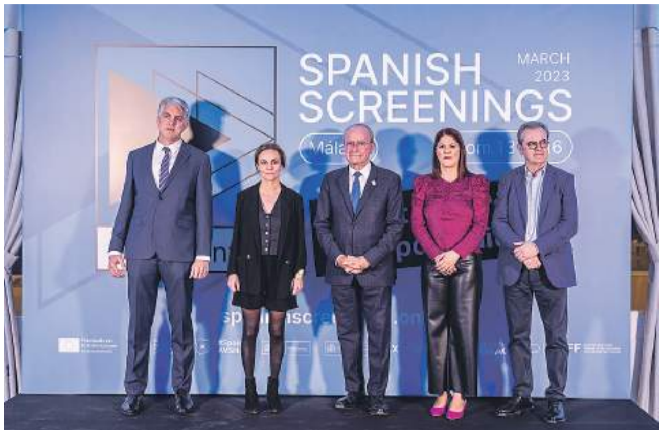
Foto de familia con las autoridades participantes en el acto de inauguración. Carlos Díaz

Y los proyectos tendrán su espacio en Spain CoproForum y se dará continuidad a los presentados en Spanish Screenings On Tour en Ventana Sur en Spanish Perspectives y Spanish Screenings.