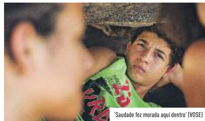
'Saudade fez morada aquí dentro' (VOSE)

21:00 SH: 'Unzué. L'últim equip del Juancar' (Unzué. El último equipo del Juancar) (VOSE), Xavi Torres, Santi