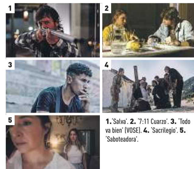
1. 'Salva'. 2. '7:11 Cuarzo'. 3. 'Todo va bien' (VOSE). 4. 'Sacrilegio'. 5. 'Saboteadora'.