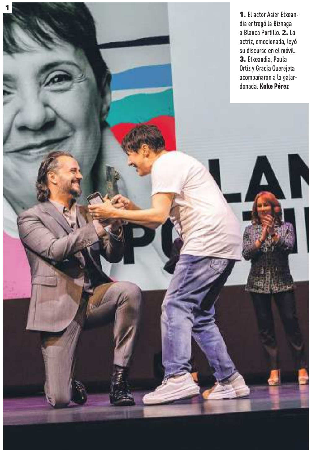
1. El actor Asier Etxeandía entregó la Biznaga a Blanca Portillo. 2. La actriz, emocionada, leyó su discurso en el móvil. 3. Etxeandía, Paula Ortiz y Gracia Querejeta acompañaron a la galar donada.

Ayer Blanca logró lo que pretendía. No se vio a la actriz; se vio a la persona. Ella, que se define como "curranta" antes que artista, ayer se curró el cariño del público.