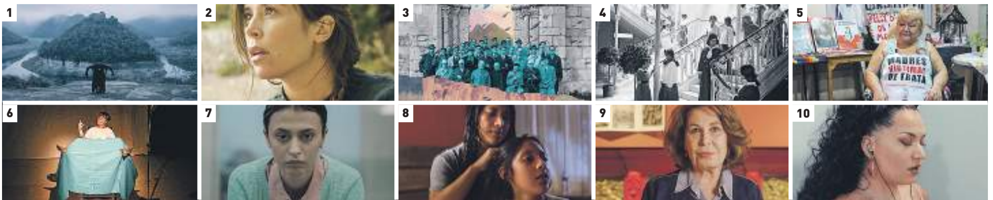
1. 'Na ribas' (VOSE). 2. 'Ellas'. 3. 'Ezohijoak' (Anómalas) (VOSE). 4. 'La residencia de señoritas'. 5. 'Insisten'. 6. 'Anatomía dunha serea' (Anatomía de una sirena) (VOSE). 7. 'Dispatchers' (VOSE). 8. 'Por Magda'. 9. 'Mujeres sin censura'. 10. 'Women in the studio (Mujeres en el estudio)'.