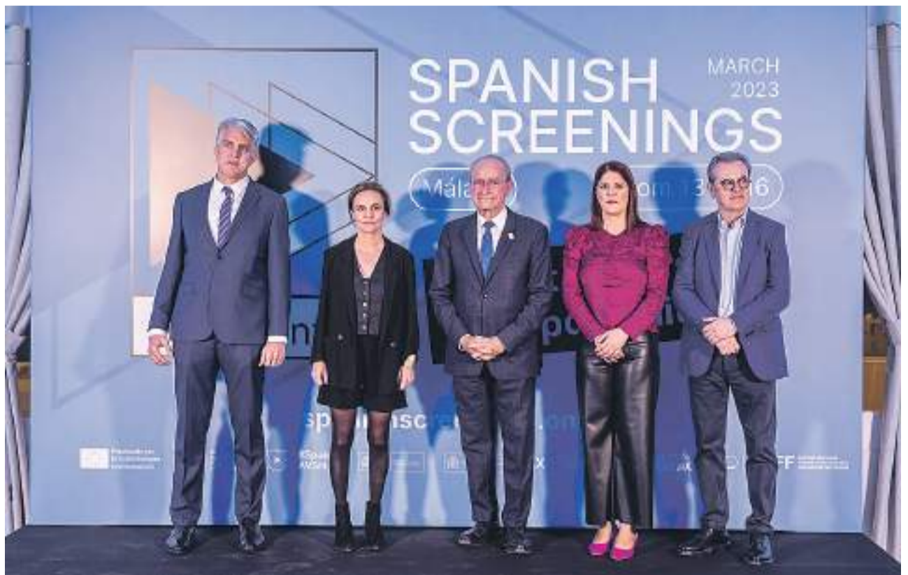
Authorities participating in the opening ceremony. Carlos Díaz

Projects will have their space in Spain CoproForum, and the ones that were presented at Spanish Screenings On Tour in Ventana Sur will continue to appear in Spanish Perspectives and Spanish Screenings.