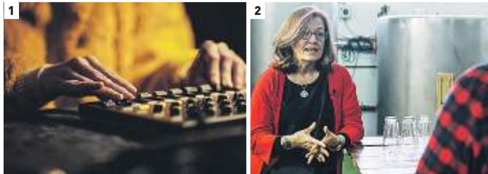
1. 'Cocina Aural'. 2. 'Birra en ruta #0 - Segovia'.