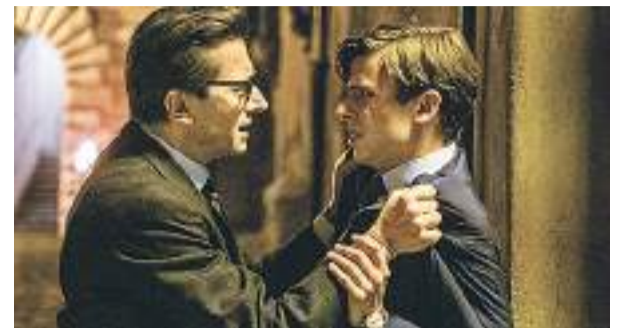
'Il signore delle formiche' (El caso Braibanti) (VOSE).