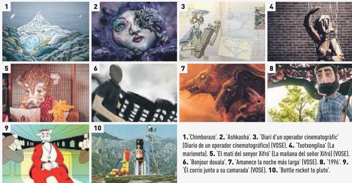
1. 'Chimborazo'. 2. 'Ashkasha'. 3. 'Diari d'un operador cinematogràfic' (Diario de un operador cinematográfico) (VOSE). 4. 'Txotxongiloa' (La marioneta). 5. 'El matí del senyor Xifró' (La mañana del señor Xifró) (VOSE). 6. 'Bonjour douala'. 7. 'Amanece la noche más larga' (VOSE). 8. '1996'. 9. 'Él corrió junto a su camarada' (VOSE). 10. 'Bottle rocket to pluto'.